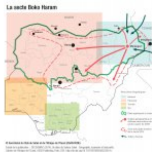
La secte Boko Haram

Au Niger, les groupes djihadistes chassés du Mali par l'armée française et repliés dans le Fezzan libyen transitent régulièrement à travers le nord désertique vers le Mali et la Mauritanie, tout en menaçant au passage les mines d'uranium d'Arlit. A l'est, la région du Djado est une zone de non droit où s'affrontent des milices pour le contrôle de mines d'or artisanales. A l'ouest l'insécurité de la région de Kidal au Mali déborde régulièrement au Niger et menace toute la région de Tahoua.