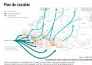
Flux de cocaïne en Afrique de l'Ouest

Une implosion du Sahel provoquerait des migrations régionales de grande ampleur et déstabiliserait les dominos que constituent les pays côtiers d'Afrique de l'Ouest dont nous avons pu mesurer les fragilités lors de la crise ivoirienne des années 1997/2011. La forte croissance économique de ces pays, tirée depuis le début des années 2000 par la hausse des matières premières, masque l'insuffisance des créations d'emploi face à une démographie galopante. L'irruption massive de migrants sahéliens y exacerberait les tensions politiques qui ont déchiré la Côte d'Ivoire depuis la mort du Président Houphouët Boigny et qui agitent périodiquement le Nigéria.